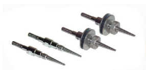
Spine filettate (attacco ø 10 mm) di ricambio Threaded pins (ø 10 mm connection) spare parts Goupille filetées (prise ø 10 mm) de rechange