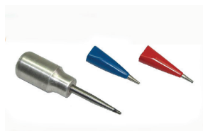
Spina per spazzolini senza gambo Pins for brushes, no shank Goupille pour brosses sans tige