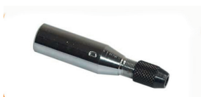
Mandrino (per spine coniche) per spazzolini con gambe Chuck (for conical pins) for brushes with shank Mandrin (pour prises conique) pour petites brosses avec tige